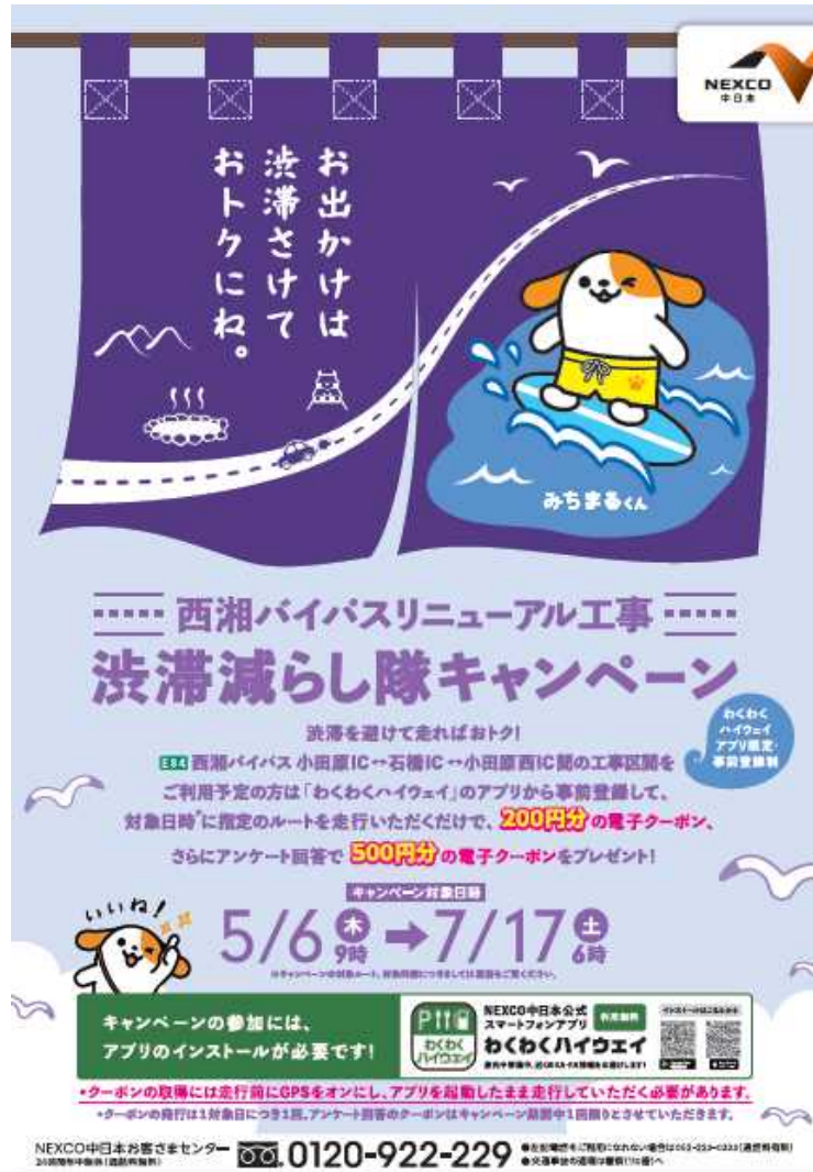
【渋滞減らし隊キャンペーンチラシ】