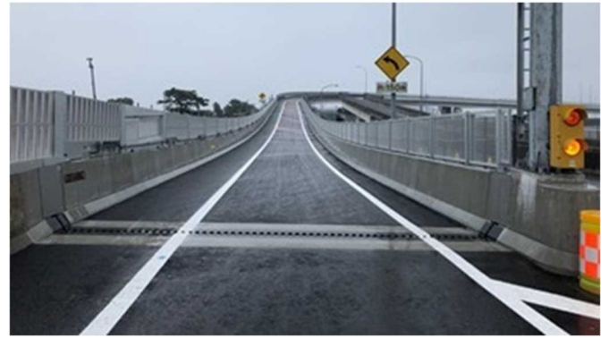
【早川Bランプ橋の床版取替え完了 7月12日】