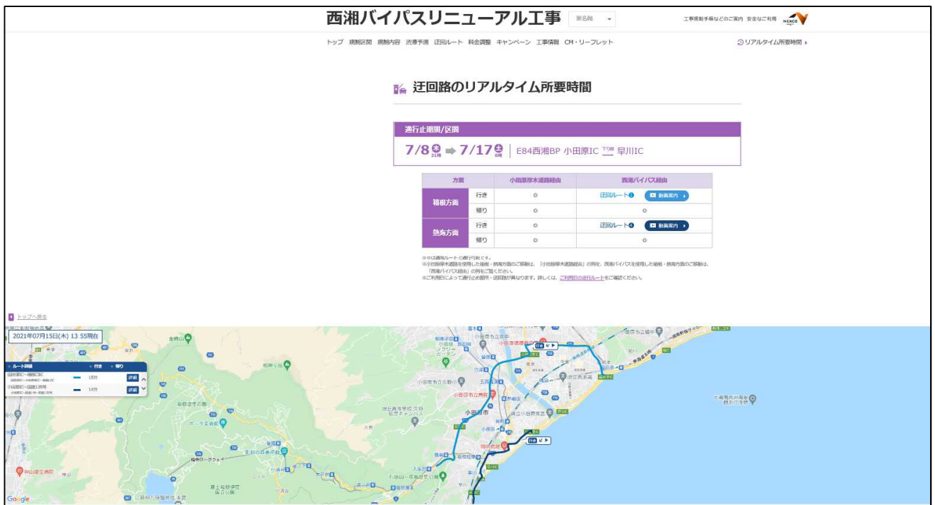
【西湘リニューアル工事専用WEBサイトによる迂回路所要時間のご案内状況】