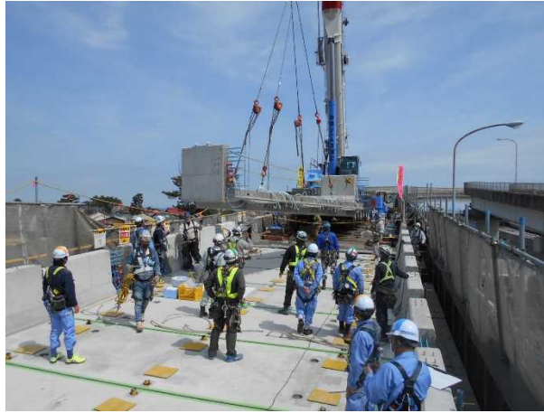
【早川Bランプ橋床版取替え状況 4月26日】