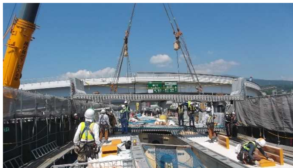
【萬丈橋下り線床版取替え状況 5月31日】