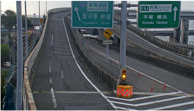
【早川Bランプ橋の床版取替え前 4月2日】