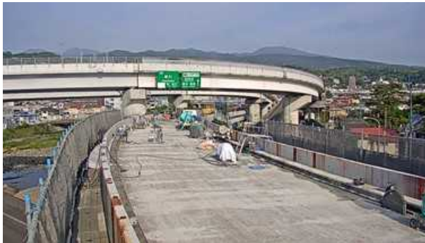
【萬丈橋下り線床版取替え前 5月10日】