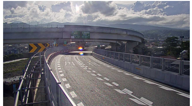
【萬丈橋下り線床版取替え完了 7月15日】