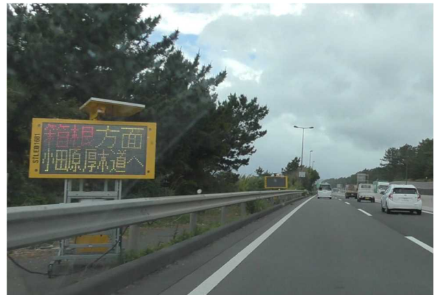
【簡易 LED 情報板による所要時間表示状況】